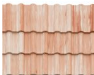
MESCLADA BRANCA COM ARGILA *