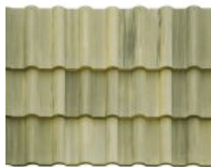
MESCLADA BEGE COM GRAFITE *