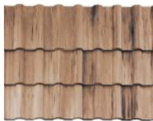
MESCLADA ARGILA COM GRAFITE *