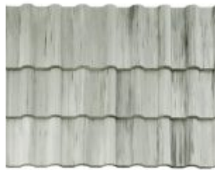
MESCLADA PÉROLA COM GRAFITE *