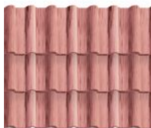
MESCLADA VERMELHA COM GRAFITE *