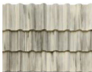
MESCLADA CHAMPAGNE COM GRAFITE *