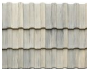
MESCLADA CHAMPAGNE COM GRAFITE *