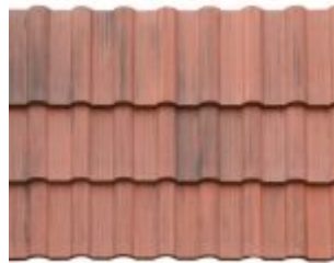
MESCLADA VERMELHA COM GRAFITE *