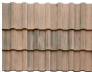
MESCLADA ARGILA COM GRAFITE *