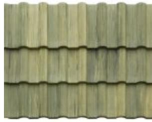
MESCLADA BEGE COM GRAFITE *