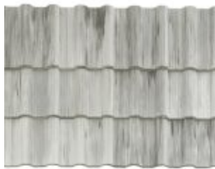
MESCLADA PÉROLA COM GRAFITE *